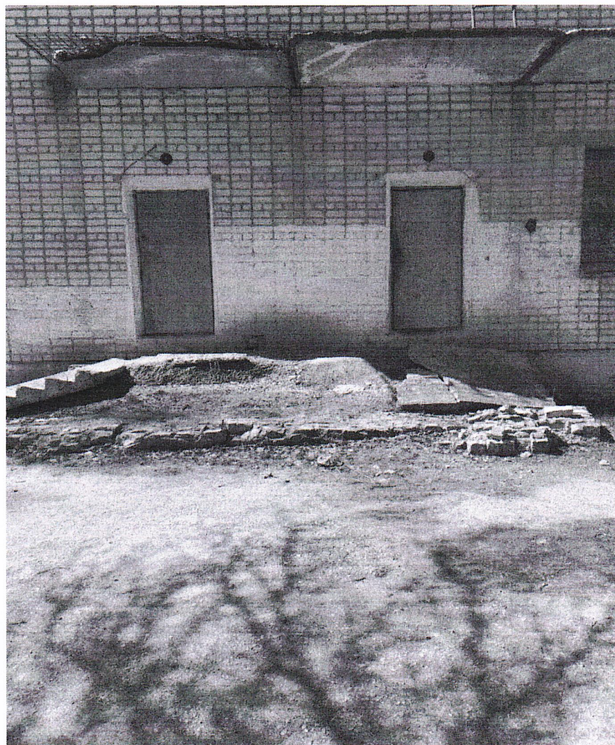
Рис.1. Фото ДО

8. 3 графических изображения, включающих: